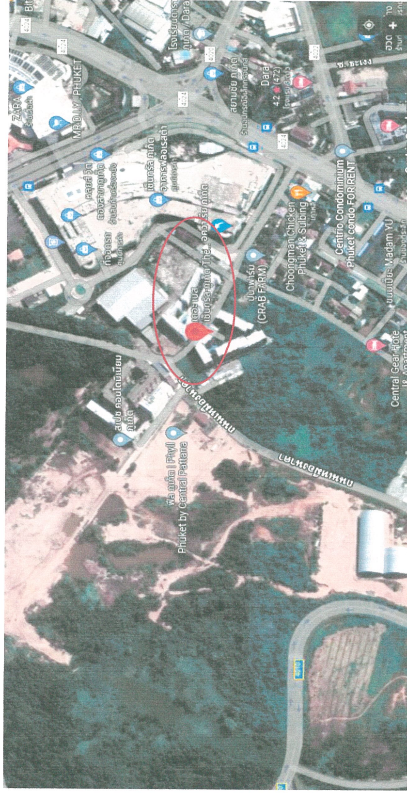
รูปภาพที่ 1.1 แผนที่ตั้งโครงการ เดอะ เบส เซ็นทรัล ภูเก็ต (Top view)